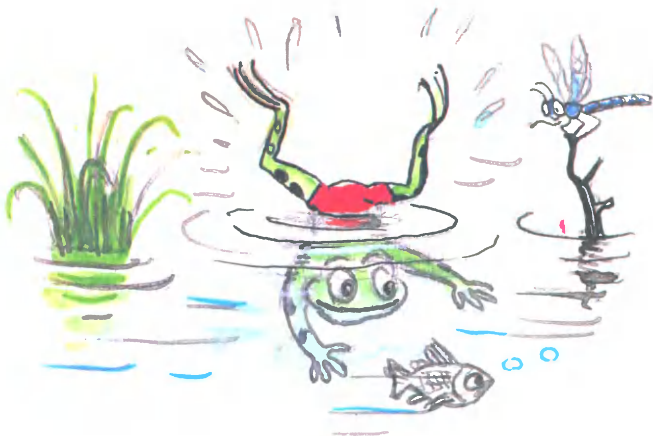
Рисунки В. Сутеева